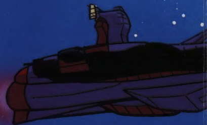
うちゅうじゅんようかん サラミスかいぞうタイプ